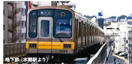
地下鉄(本郷駅より)